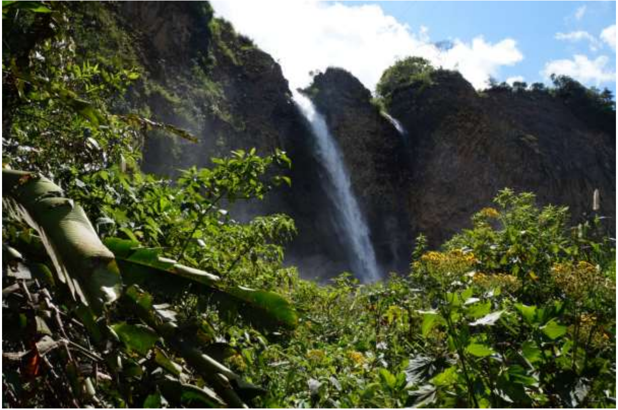
Das Paradies ☺